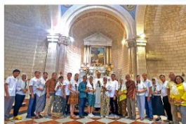
Cana Wedding Church