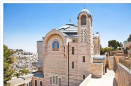
Church St. Peter Gallicantu